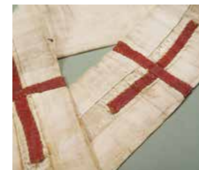
Pallium de Césaire d'Arles