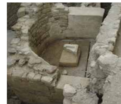
Découvertes archéologiques Enclos Saint-Césaire 2014