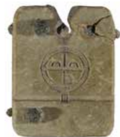
Amulette du V e siècle Cité Saint-Blaise