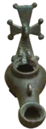
Lampe à huile du V e siècle