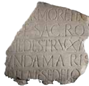
Fragment de sarcophage de Césaire d'Arles

Préface – Martine Vassal, présidente du Conseil départemental des Bouches-du-Rhône Preface – Martine Vassal, President of the County Council Préface – Christophe Dufour, archevêque d'Aix et d'Arles Preface – Christophe Dufour, Archbishop of Aix and Arles Remerciements / Thanks to the Contributors Présentation des contributeurs / Introduction the Contributors Chronologie de Saint Césaire d'Arles (470-542) Chronology of Caesarius of Arles (470-542)