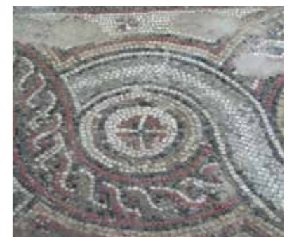
Mosaïque de la basilique Enclos Saint-Césaire