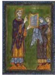
Césaire d'Arles : enluminure du XII e siècle - Allemagne